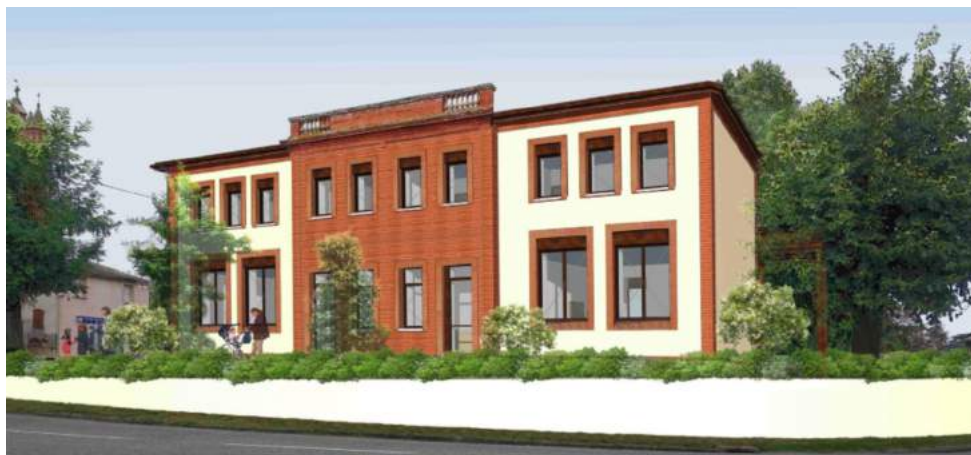
Vue du bâtiment cours des Ravelins

Le chantier a pris du retard, mais il ne faut pas le regretter. Devant la forte hausse des coûts, la mairie a souhaité prendre du temps pour renégocier avec les entreprises et même relancer un appel d'offres pour le lot n°2 (menuiserie-serrurerie). Ce n'est donc que le 13 novembre que les actes d'engagement ont été signés pour un montant total de 632 274 € HT. C'est une économie de près de 130 000 € qui a été réalisée par rapport aux premières offres. A ce jour 289 000 € de subventions ont été obtenues de la Région et du Département. Une demande de subvention est en cours dans le cadre du programme Européen «Leader». Les travaux de reconstruction devraient se poursuivre en fin d'année ou tout début 2020.