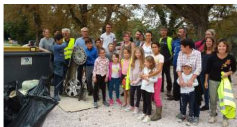
Grands et petits mobilisés pour l'environnement

Bonne mobilisation pour ce rendez-vous annuel. Bien qu'en légère diminution par rapport à l'année précédente, le volume de la collecte de déchets a été abondant. La canette en alu est devenue la star que l'on retrouve dans tous les fossés, ainsi que les emballages de restauration rapide d'une marque bien connue ! Merci à tous les participants pour ce geste citoyen !